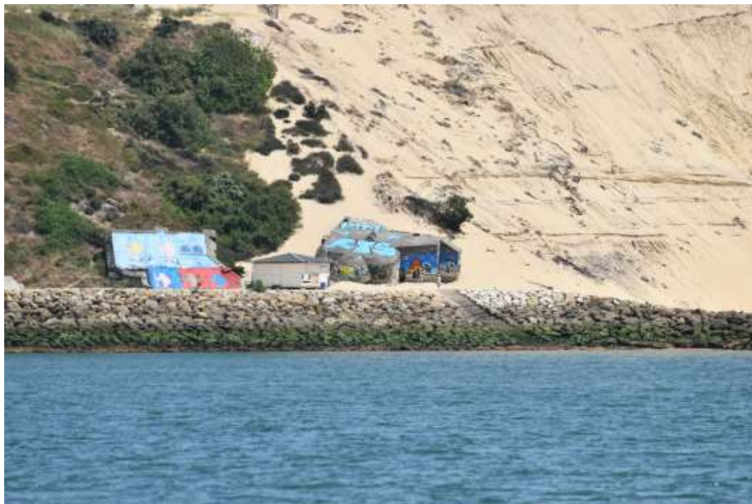
Amer cité à l'article 1 - limite nord Blockhaus au pied du lieu-dit « La Corniche »