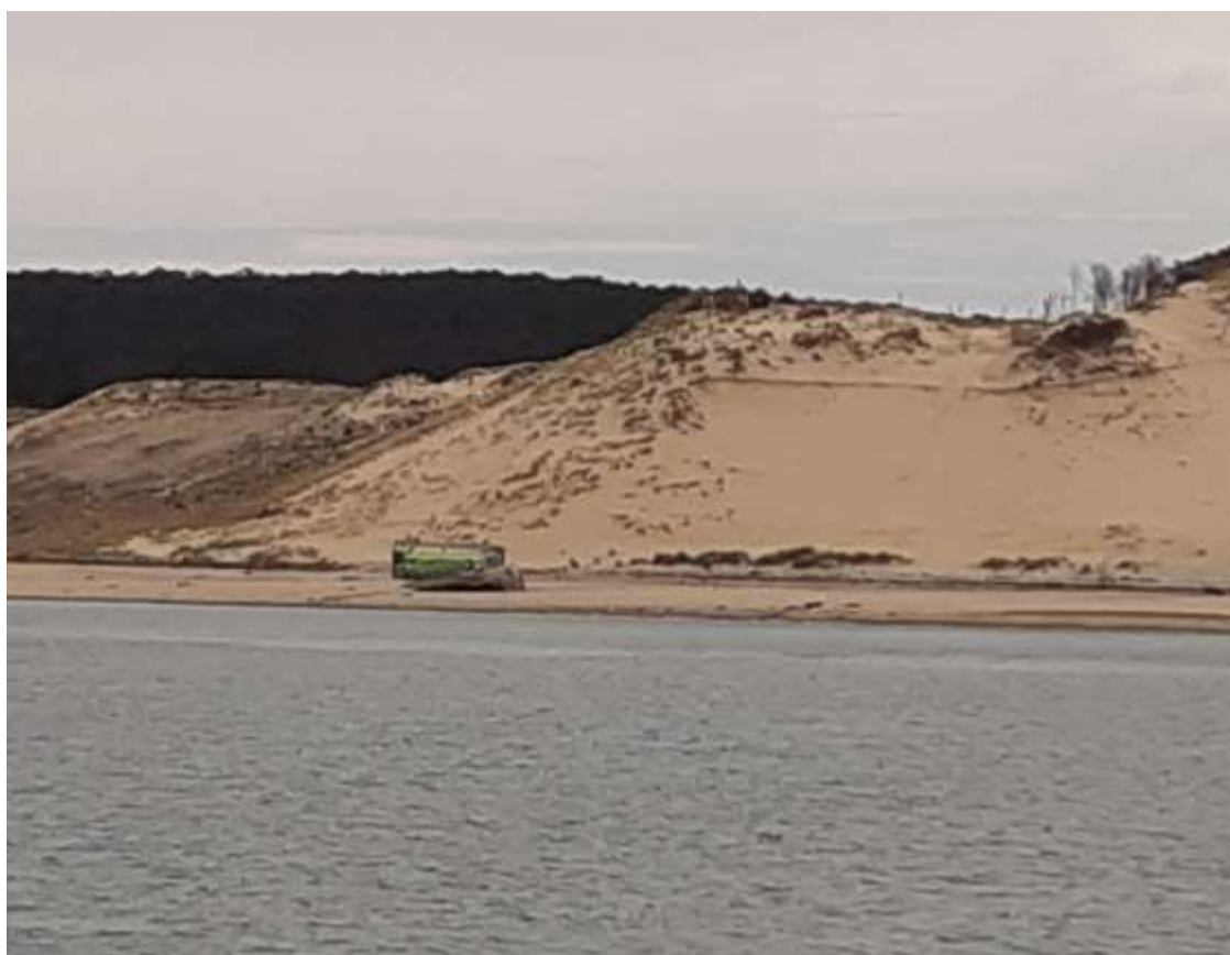
Amer cité à l'article 1 - limite sud Blockhaus du Gaillouneys